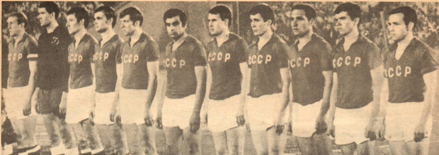
Beim V. Deutschen Turn- und Sportfest im vergangenen Jahr in Leipzig spielte unsere Nationalmannschaft gegen die UdSSR 2 : 2. Damals trat die sowjetische Elf